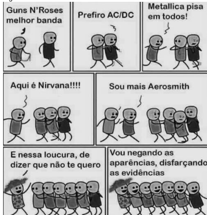
Figura 2: Alma do Rock

33. De acordo com a definição de musicoterapia (Ubam, 2018) o/a musicoterapeuta, facilita um processo musicoterápico a partir de avaliações específicas, com base na musicalidade e na necessidade de cada pessoa e/ou grupo. Estabelece um plano de cuidado e um processo musicoterápico a partir do vínculo e de avaliações específicas atendendo às premissas de promoção da saúde, da aprendizagem, da habilitação, da reabilitação, do empoderamento, da mudança de contextos sociais e da qualidade de vida das pessoas, grupos e comunidades atendidas." [...] Sabe-se que cada pessoa tem suas preferências musicais e de forma particular cada cliente/ paciente/ usuário ou participante, tem sua identidade sonoro-musical. A partir da tirinha abaixo é INCORRETO afirmar: